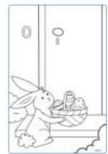
Il coniglietto pasquale consegna i suoi cestini.