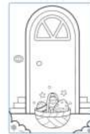
Forse ne ha lasciato uno anche per te!