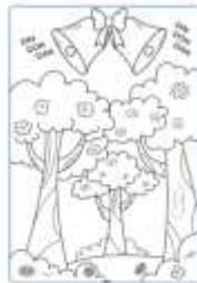
In un seleggiato giorno di primavera, quando suonano le campane della chiesa