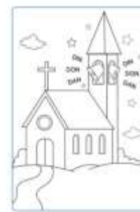
Così adesso tutti i bambini sanno che la mattina di Pasqua, quando suonano le campane della chiesa,