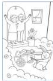
Il tempo passa, i nani ora sono troppo anziani. Il loro coniglietto intreccia i cestini e poi decora le uova di cioccolato e le consegna la mattina di Pasqua.