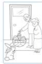
I nani portano ad ogni bambino un cestino di paglia intrecciato pieno di uova di Pasqua; il loro coniglietto osserva.