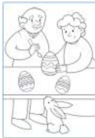
Poi decorano le uova di cioccolato e il loro piccolo coniglietto li osserva.