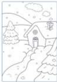
In un giorno di inverno,