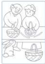
Uno coppia di nani intreccia cestini di paglia.